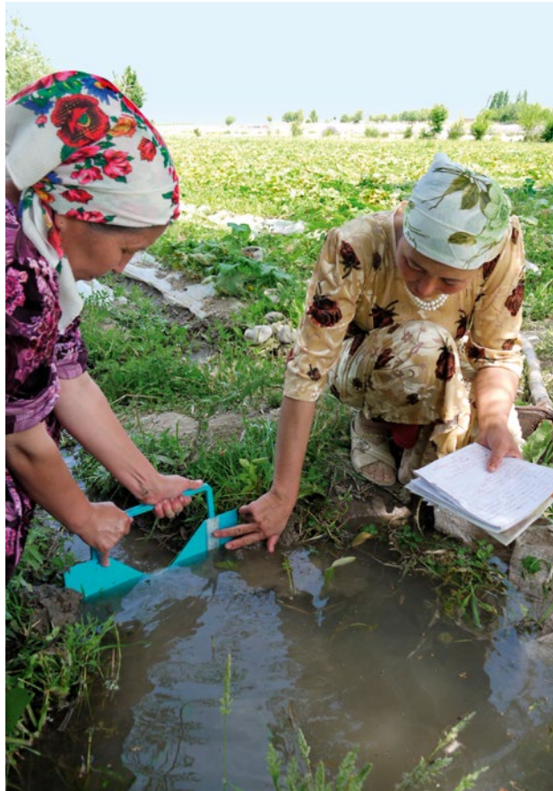
Dans ses projets, Helvetas s'engage pour une gestion durable des ressources en eau, comme ici, au Kirghizistan.

..... Conférence-débat «Comment assurer une gestion durable et collective de l'eau?»