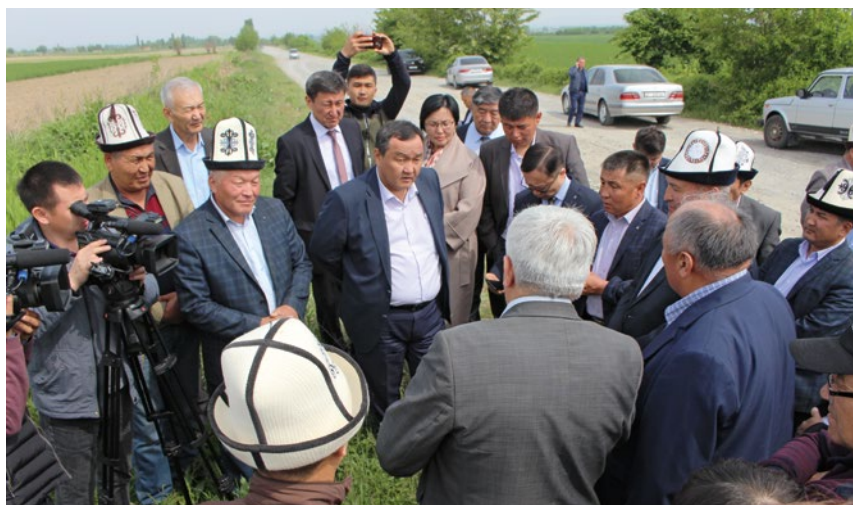
Premier succès: un député (au milieu) écoute les paysans, qui lui exposent leurs revendications.