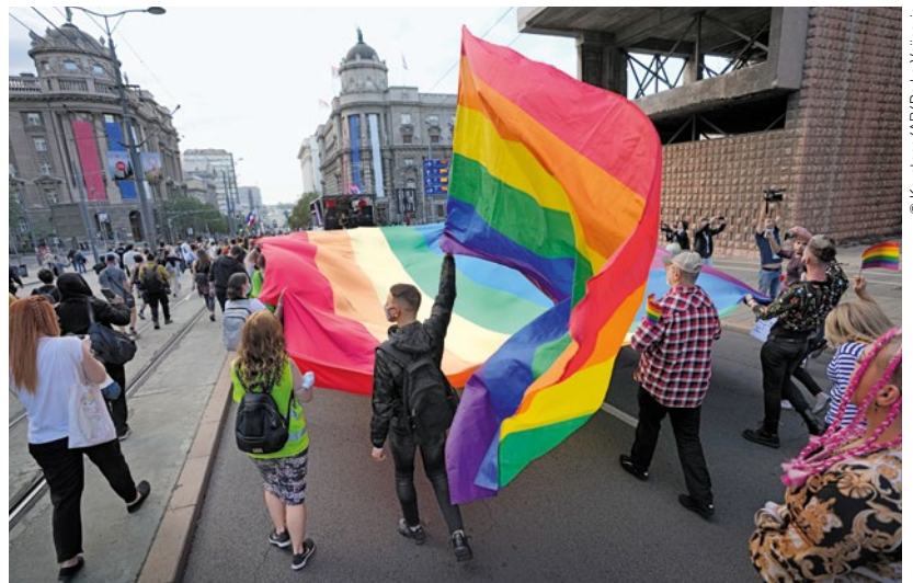
Gay Pride à Belgrade, la capitale serbe. Les personnes participantes se battent sans relâche en faveur de l'égalité des droits pour la communauté LGBTQI+.