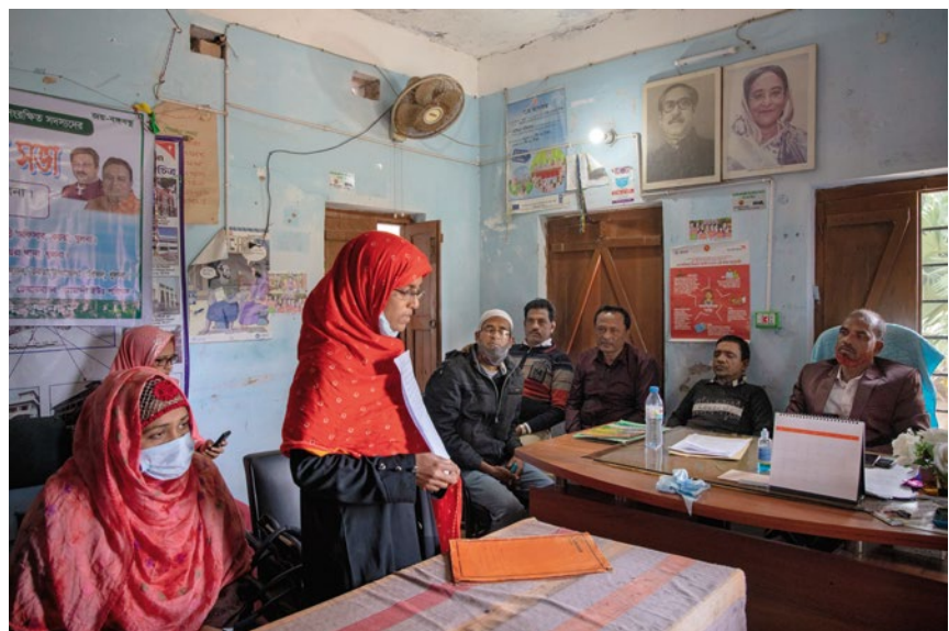
La porte-parole du parlement des mères de Koyra demande à la commune des toilettes pour tous.